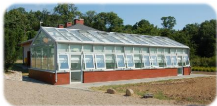
Szkółka Drzew i Krzewów