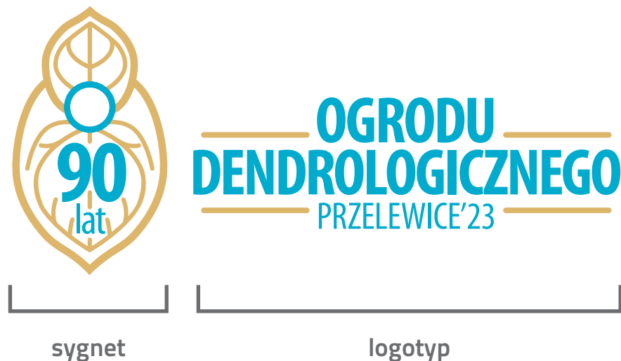
Wersja podstawowa znaku pozioma